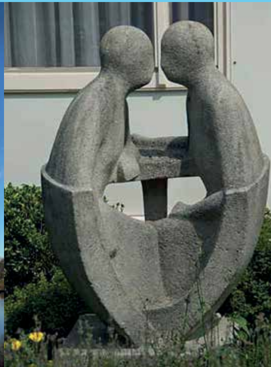
Figuren aan tafel Warmond

Jaarboekje seizoen september 2024 t/m 31 december 2024