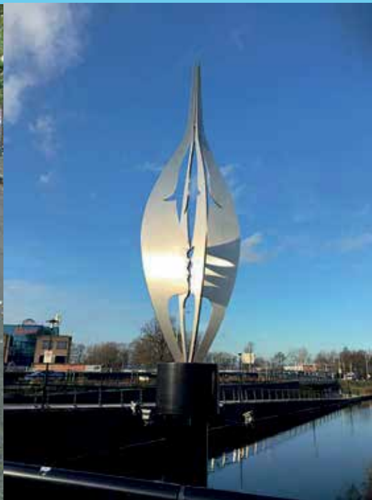
De Kus Voorhout