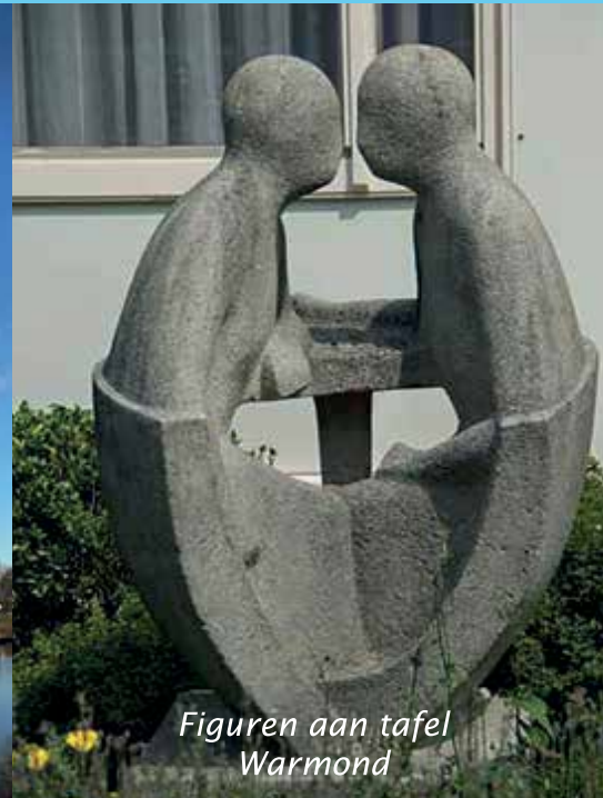
Figuren aan tafel Warmond

Een extra dik nummer met de agenda voor de feestdagen en het activiteitenoverzicht 2025